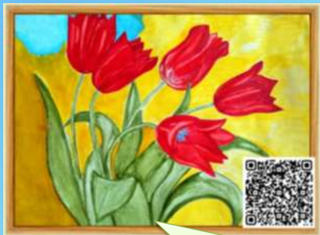
1.«Травянистые культурные декоративные растения (Цветы)»